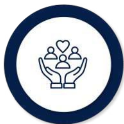
Măsuri suport în domeniul Serviciilor

În funcție de nevoile familiei/persoanei singure, venitul minim de incluziune este însoțit de alte măsuri de asistență socială complementare, acordate în bani și/sau în natură: